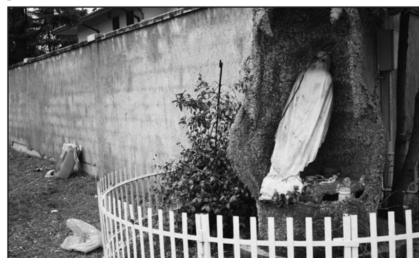
La brutta e spiacevole sorpresa degli abitanti del villaggio Marcolini.

Macelleria • Gastronomia Salumi • Formaggi Frutta • Verdura • Pane