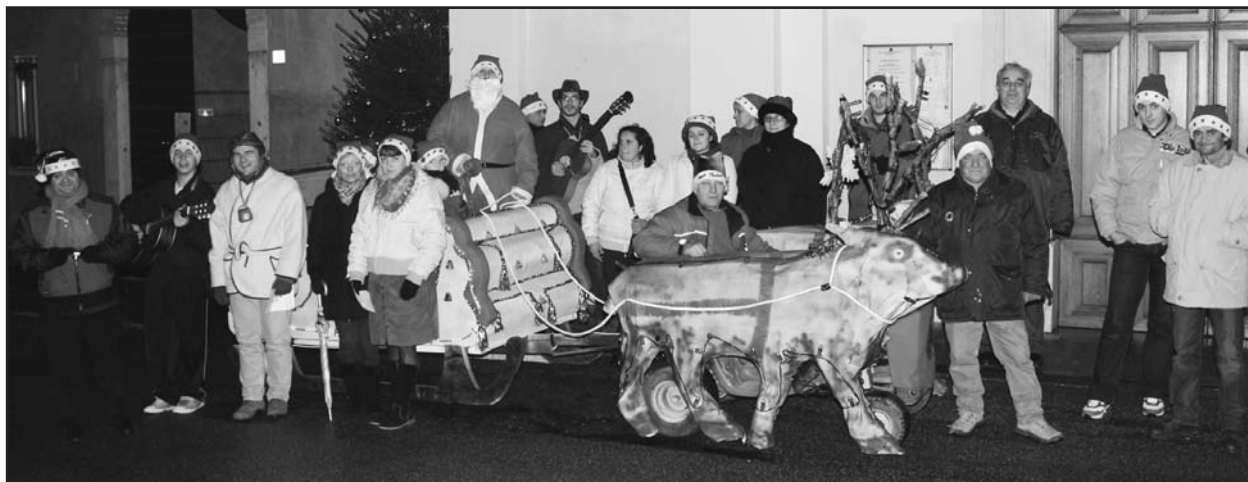
Il Gruppo Parrocchiale di Borgosotto in partenza per gli auguri di Buon Natale.