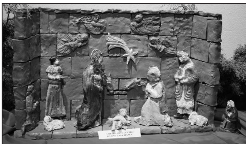
Presepe realizzato dal Gruppo Arte Centro Diurno Casa Bianca.