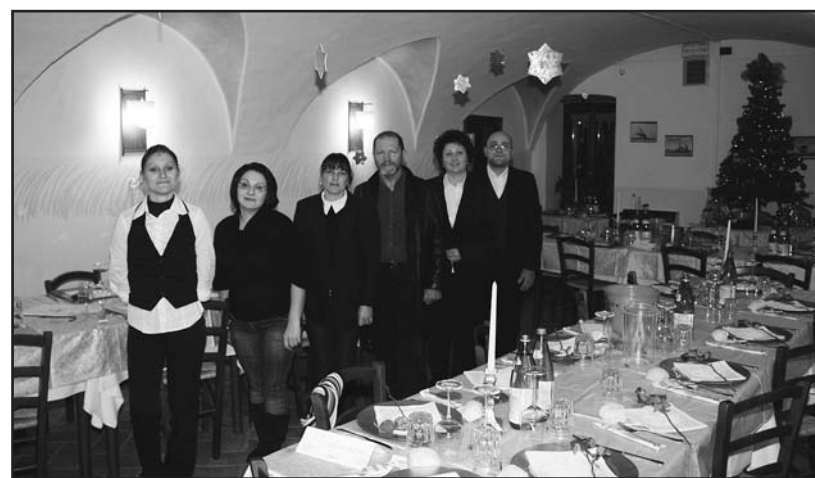
A Bredazzane festeggiato "in casa" l'ultimo dell'anno.